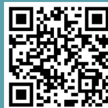
Livret de formation